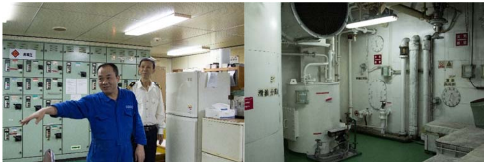
↑ 熱情為我們介紹的輪機長