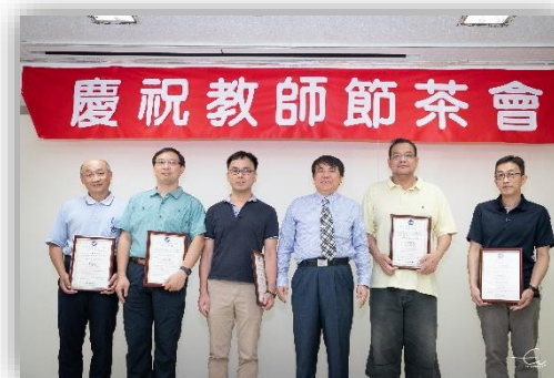
108學年度教學傑出暨教學優良教師