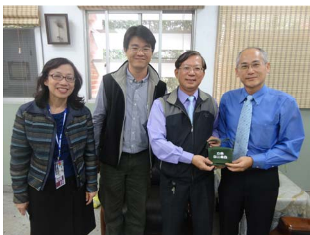
*吳副校長與該校師長合照